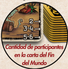
Cantidad de participantes en la carta del Fin del Mundo