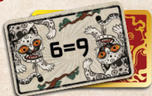
Cartas de Picante Extremo