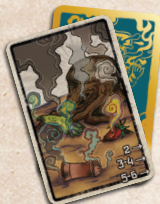
Carta del Fin del Mundo