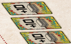
Cartas de Trofeo