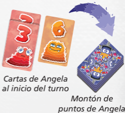
Cartas de Angela al inicio del turno

Nota: Este paso no se tiene en cuenta si no se tienen cartas al principio del turno (como en la primera ronda).