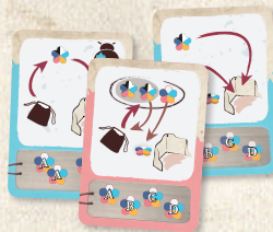
3 Cartas de Maestría