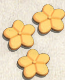
18 Flores amarillas