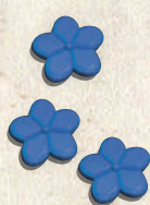
18 Flores azul oscuro