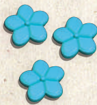
18 Flores azul claro