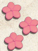
18 Flores rosas