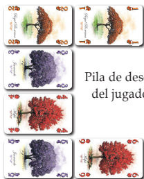
Pila de descarte del jugador 2